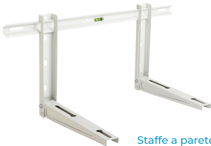
Staffe a parete per unità esterne