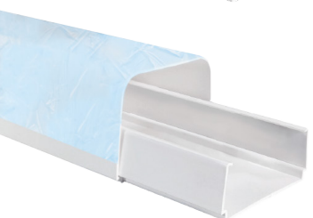
Canalina avvolgibile con pellicola