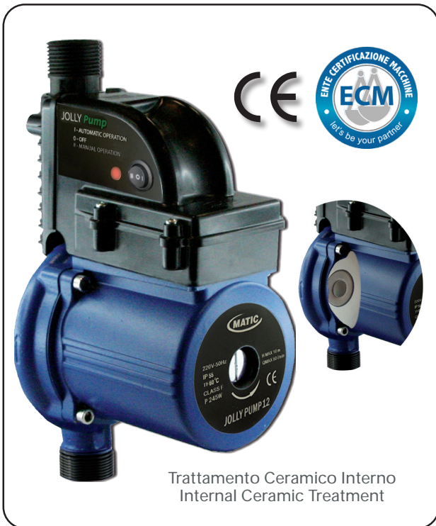
Trattamento Ceramico Interno Internal Ceramic Treatment

- All'apertura di un qualsiasi rubinetto, il naturale movimento dell'acqua nella tubazione, purché superiore a 3 lt/min, viene intercettato dalla valvola di flusso interna all'apparecchio, determinando la partenza del motore, garantendo un flusso costante per l'intera durata dell'utilizzo alla doccia.